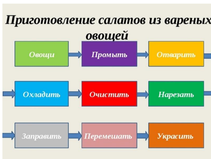
Схема приготовления салатов с вареными овощами.

Наше сегодняшнее занятие подошло к концу. Ребята, я была так рада работать с такими умными, умелыми, талантливыми ребятами. До свидания! Желаю всем вам счастья!