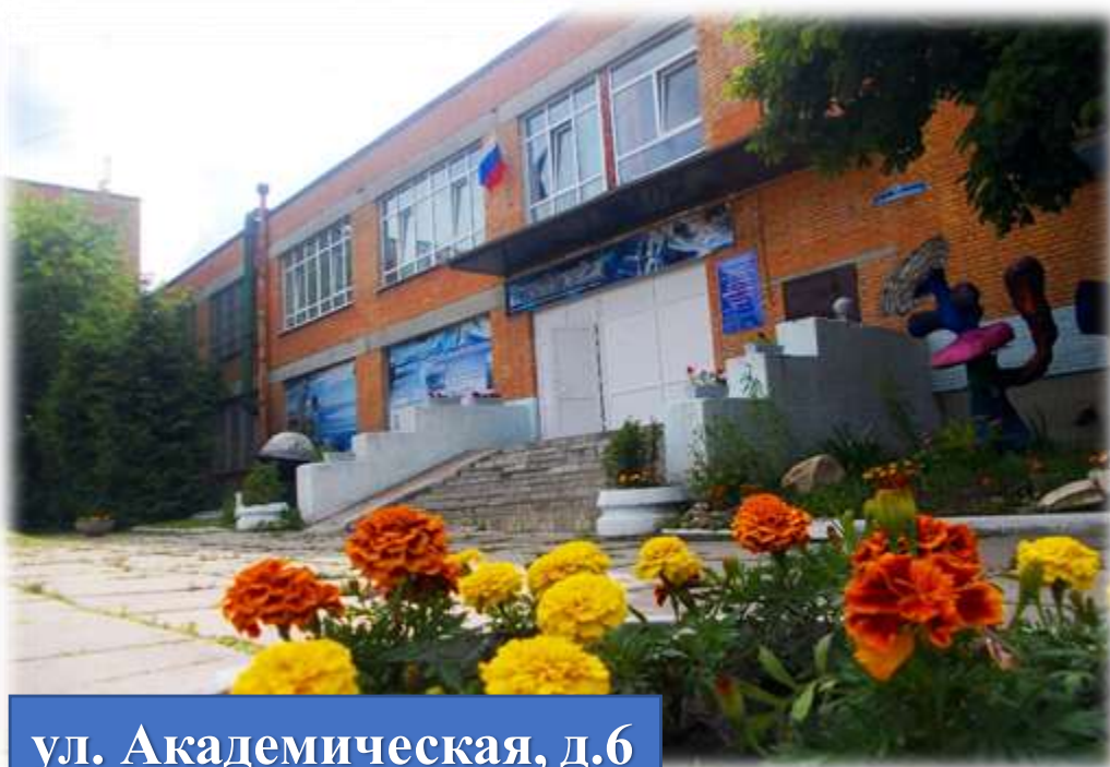
ул. Академическая, д.6