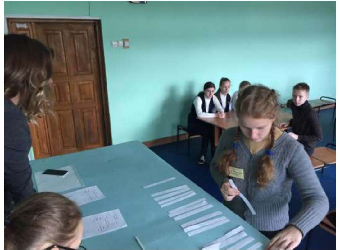
«Известный и неизвестный Циолковский»