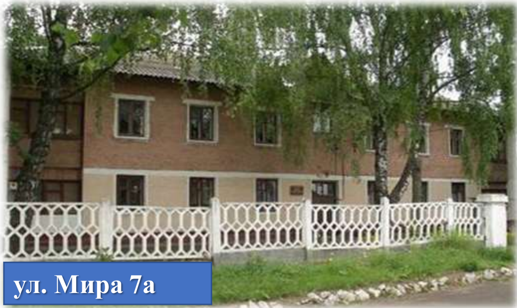
ул. Мира 7а