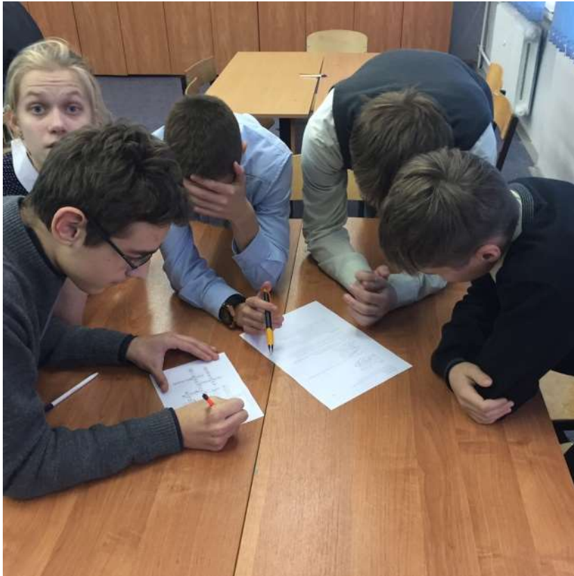
«Кто Вы, профессор Чижевский?»