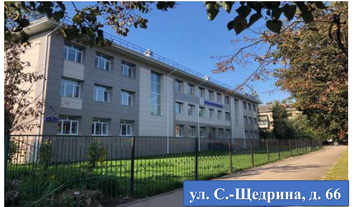
ул. С.-Щедрина, д. 66