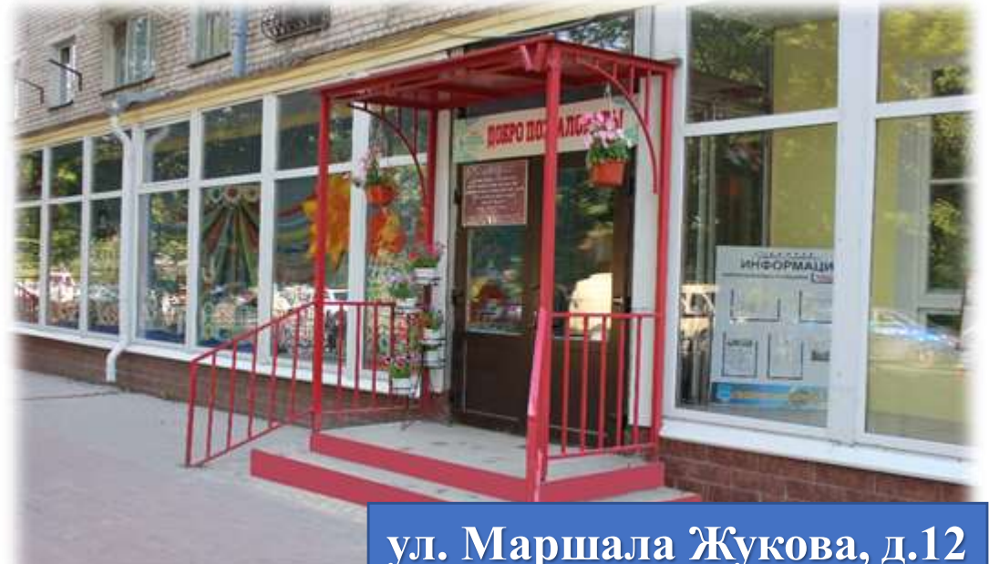
ул. Маршала Жукова, д.12